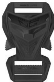
25 MM MALE AND FEMALE PART