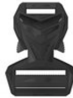
HYBRID – COMBINATION OF 45 MM MALE AND 25 MM FEMALE PART