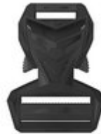
HYBRID – COMBINATION OF 45 MM MALE AND 25 MM FEMALE PART