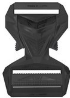
45 MM MALE AND FEMALE PART