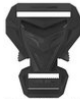
HYBRID – COMBINATION OF 25 MM MALE AND 45 MM FEMALE PART