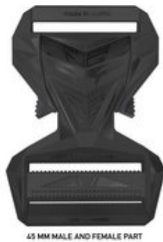
45 MM MALE AND FEMALE PART